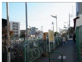
② 右を見たときの風景