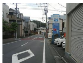
⑧ 4つ目の橋で右折したときの風景