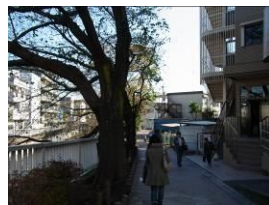
⑥ 遊歩道を10分ほど進みます