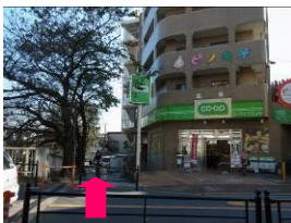
⑤ この道に入ります