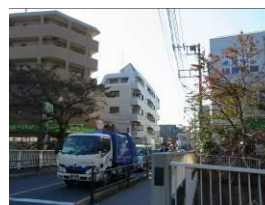
③ 橋の手前にある信号で道を渡った後、橋を渡ります