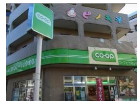
④ コープまで来たら、手前を左折