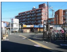
① 2番出口正面の風景