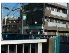
⑦ 3つ目の橋の対岸にあるファミリーマート