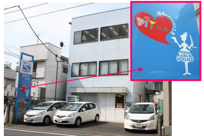
⑨2軒目にあるのが、練馬工房です♪ 看板が新しくなりましたよ~(*^_^*)