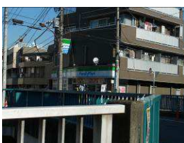
⑦3つ目の橋の対岸にあるファミリーマート