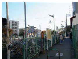
②右を見たときの風景