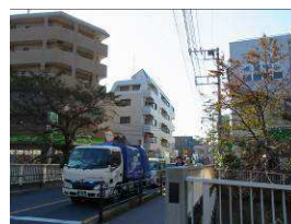
③橋の手前にある信号で道を渡った後、橋を渡ります