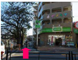
⑤この道に入ります