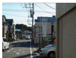
⑧4つ目の橋で右折したときの風景