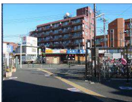
①2番出口正面の風景