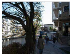
⑥遊歩道を10分ほど進みます