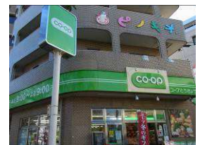
④コープまで来たら、手前を左折